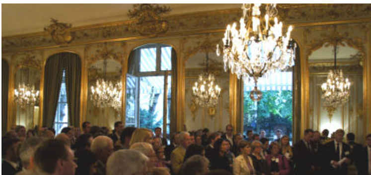
Une assistance nombreuse et attentive